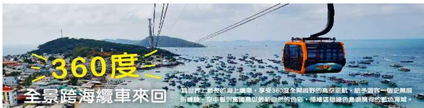
為世界上最長的海上纜車，享受360度全開視野的高空巡航，給予遊客一個史無前例體驗，空中看到富國島以最新鮮自然的色彩，描繪這個綠色島嶼擁有的藍色海域。

【 360度全景跨海纜車來回 】為世界上最長的海上纜車，是越南太陽集團最閃亮的娛樂品牌，為您帶來世界上最長的海上纜車（長度約7,899.9 公尺），採用最新的三線電纜系統連結AnThoi 鎮Hon Thom 島，由起始點到終點站約15 分鐘。該系統有69輛車廂，每車廂最多乘載30名乘客。纜車之旅中享受360 度全開視野的高空巡航，給予遊客一個史無前例體驗，空中看到富國島以最新鮮自然的色彩，描繪這個綠色島嶼擁有的藍色海域，還有當地漁船點綴海面，療癒的畫面賦予旅遊最美好體驗與感受。