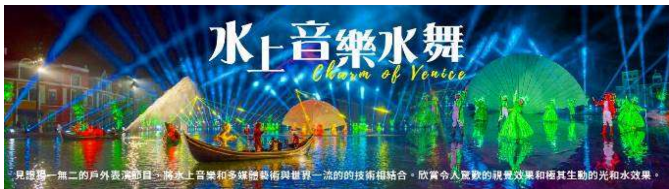
見證獨一無二的戶外表演節目，將水上音樂和多媒體藝術與世界一流的技術相結合。欣賞令人驚歎的視覺效果和極其生動的光和水效果。

【 威尼斯大型水舞秀 】在每天晚上入夜後 10 點在愛琴湖上，就會上演一場結合光雕投影、水舞、舞蹈、音樂的「 威尼斯大型水舞秀 」，長達 30 分鐘的演出以戴著面具的宮廷貴族，乘著貢多拉出場進行海上巡禮打頭陣，穿著華麗服飾的宮廷貴族戴著代表威尼斯面具節的面具站在船上，與沿岸遊客打招呼，當一艘艘船退場，在舞台正中央正式開啟了一場華麗的宮廷演出。該劇再現了天才畫家與佳人在威尼斯河畔的浪漫愛情故事。一段相遇-相愛-分離-重逢的旅程，給觀眾帶來了諸多感慨。結合光雕投影、大型水舞，還有雷射光束，貴族們在海上舞台中央隨著音樂翩翩起舞，時而激烈、時而婉轉浪漫，最後以變化萬千的雷射投影搭配水幕帶起整場演出高潮，精彩演出成為富國島上必看三大秀。