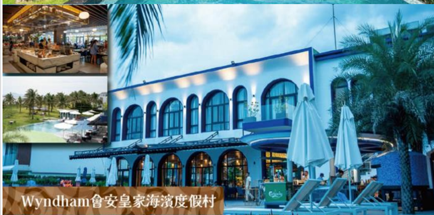
Wyndham會安皇家海濱度假村