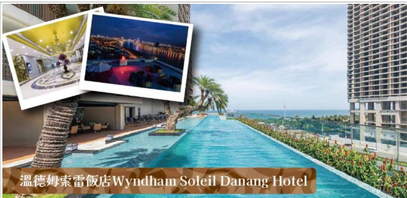
溫德姆索雷飯店 Wyndham Soleil Danang Hotel