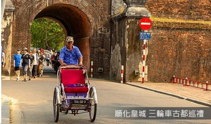
順化皇城 三輪車古都巡禮

此寺建於香江畔的山丘上，寺前有福緣塔於 1844 年由阮朝第三位皇帝啟定皇帝所建，塔右側有碑石閣、左側有六角閣，塔後聖殿則供奉三寶佛。其所在位置據說為龍脈之首，不僅地理風水好連風景視野都是上乘之選。