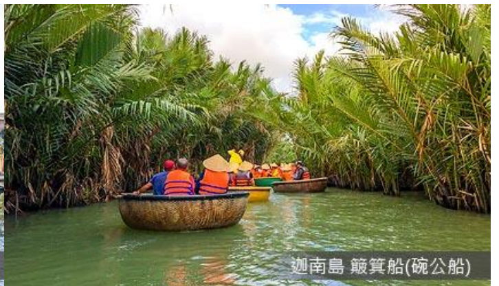
迦南島 簸箕船(碗公船)