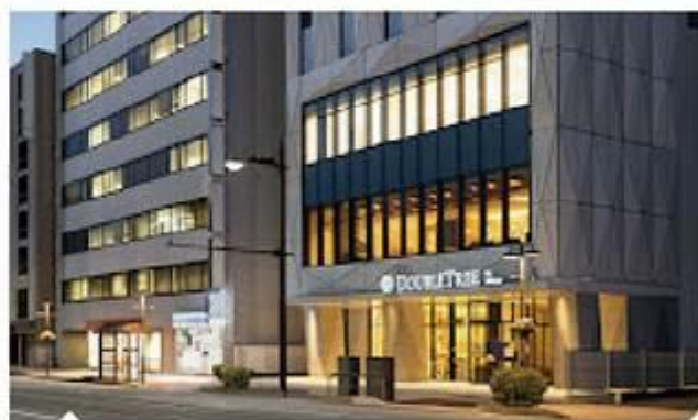
富山希爾頓逸林酒店