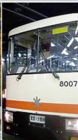
立山隧道無軌電車 10mis