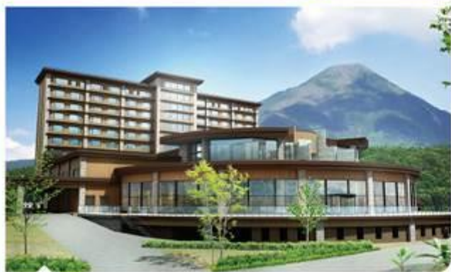
白樺度假村池之平飯店