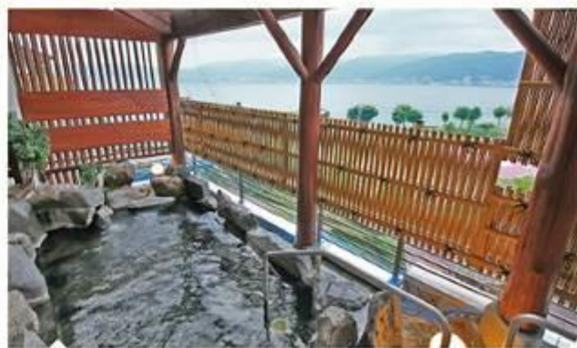
RAKO 華乃井飯店 露天風呂