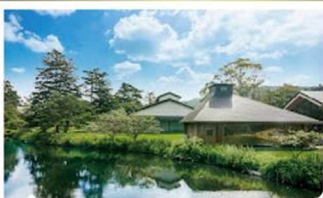
輕井澤皇家王子大飯店 西館