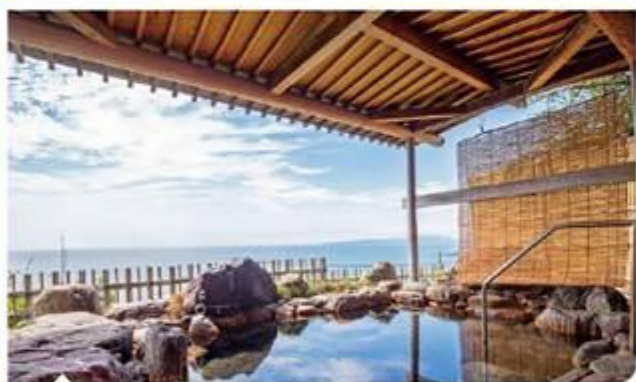
元湯 磯波風 溫泉飯店 露天風呂