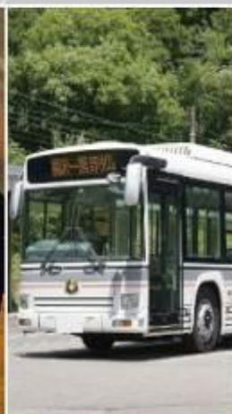
開電隧道電氣巴士 16mis