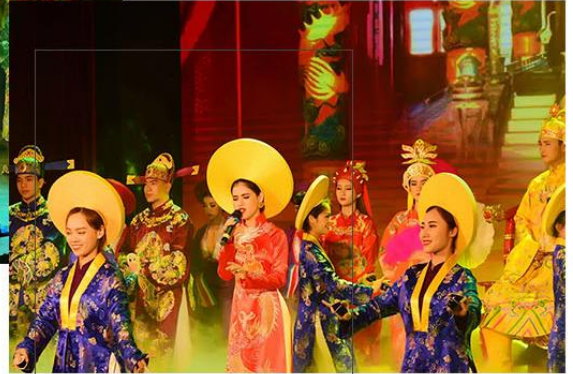
Ao Dai Show Da Nang